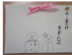
4年生 詩集を作りました。